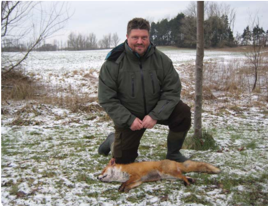
En stolt skytte med årets ræv.

Efter høsttid satser vi på at gå gravene efter, så de kan være klar til næste vinters rævejagt. Skulle du være interesseret i at deltage i renoveringen samt i jagten til vinter, kan du kontakte Poul Poulsen på 46 36 15 25 eller mail p.poulsen@c.dk.