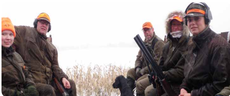
En vognfuld forventningsfulde jægere.

Vi sluttede af med en flot vildtparade, med lidt over 50 stykker vildt. Det var afslutningen på en rigtig god og hyggelig dag med flot landskab, masser af vildt og et rigtig hyggeligt selskab.