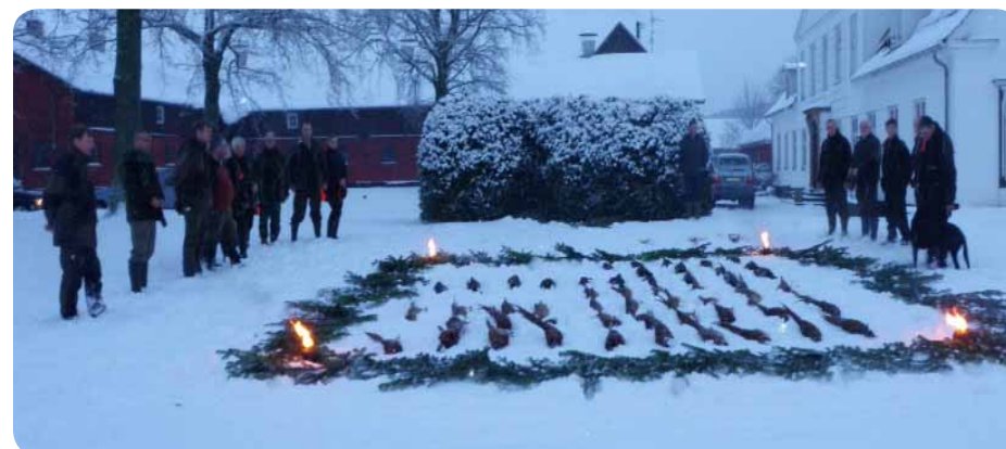
En flot parade.